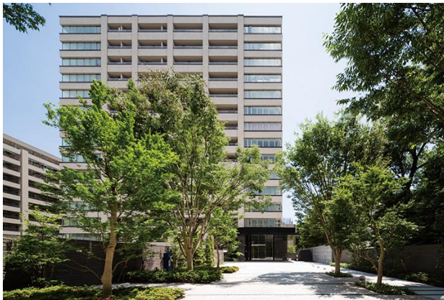
贅沢な空間が広がる共用部